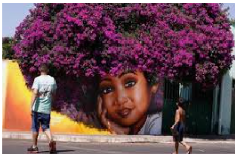
Pintura em muro